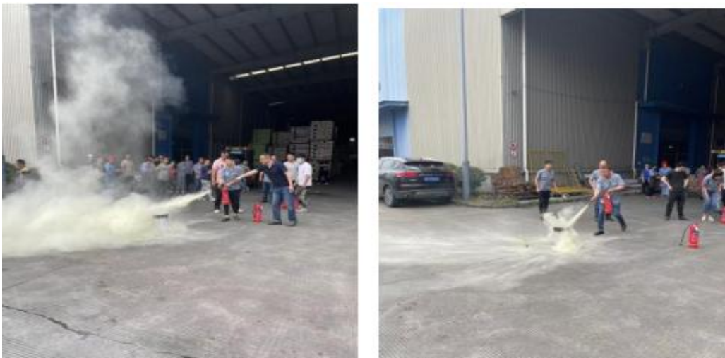
图 6.3-01 2021 年应急演练记录

为规范生产安全事故应急预案管理工作，迅速有效处置生产安全事故，依据《中华人民共和国突发事件应对法》、《中华人民共和国安全生产法》和《突发事件应急预案管理办法》等法规要求，公司制订了《生产安全事故专项应急预案》和《生产安全事故综合应急预案》。为了检验公司事故应急预案的合理性、实用性和可操作性；验证本公司应急体系及应急组织反应能力；锻炼各应急工作组和普通员工对应急知识、应急职责和应急程序等的熟知程度和实战能力；以便预案各种应急程序进一步掌握，磨合各应急工作组应急响应和协同应急处置能力。锻炼事故状态下，事故的有效收集和处置能力。测试公司应急响应和应急处置时间，暴露存在的问题，以便进一步完善应急预案和配备应急所需的设备器材。公司每年都会各类应急预案进行每年举行火灾消防、管道泄漏等各种应急预案的演练，演练后我们都会安排《应急演练评价》，总结演练，提出改进建议，不断地完善应急预案，更好地预防事故发生后应急措施的落实和有效性。