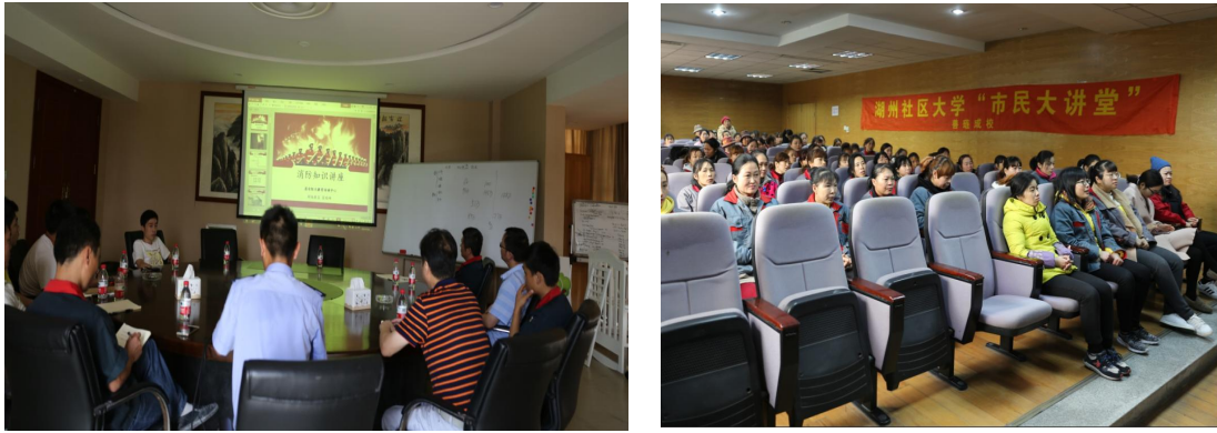
图 3.2-1 各类培训活动

公司每年针对实际和市场形势，识别各部门的培训需求，制定员工培训规划和年度计划，开展职工教育培训，包括质量意识、质量知识、管理制度、专业知识等培训内容。公司每年制定并下发了《年度培训计划》等，对质量诚信教育进行了安排布置。